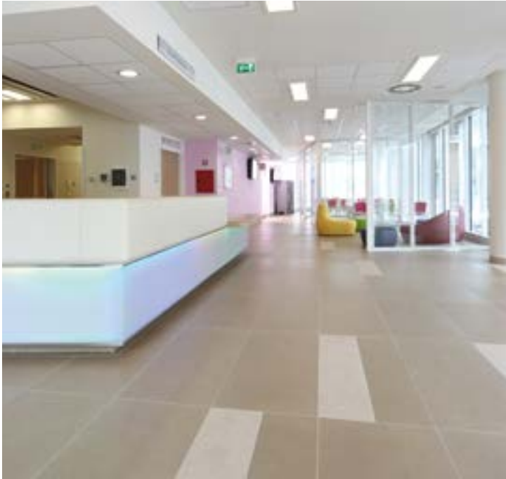
Pietro Barilla Hospital Parma, Italy