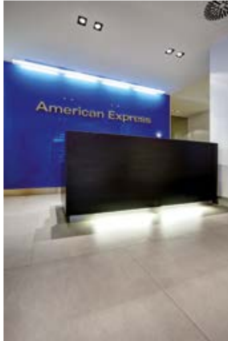
American Express Agency Rome, Italy