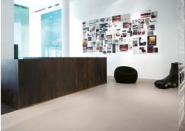
B&B ITALIA Store Milan, Italy