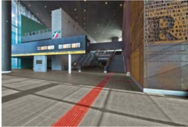
Tiburtina High-speed railway station Rome, Italy