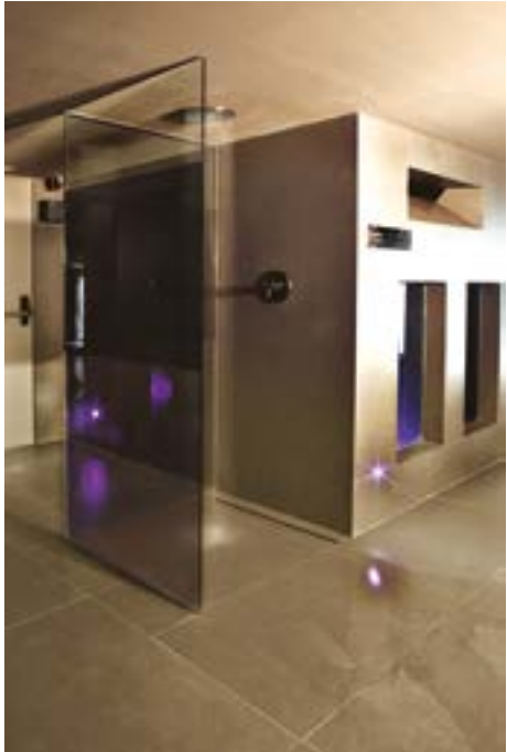
Albir Playa Spa Hotel Alicante, Spain