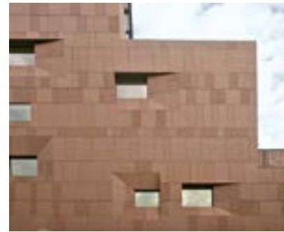
Ville Urbane Milano, Italy