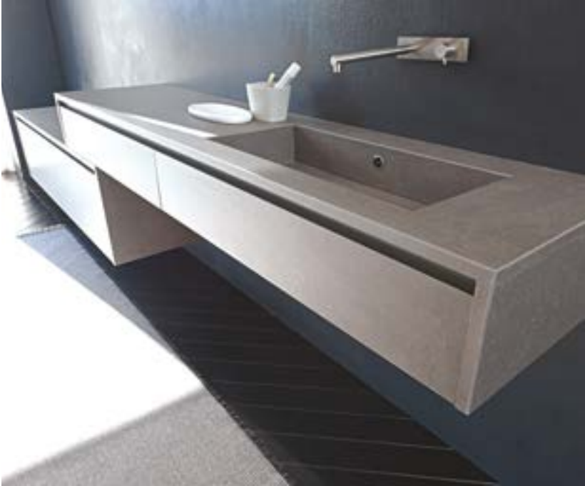
Basin and Bathroom furniture by Modulnova