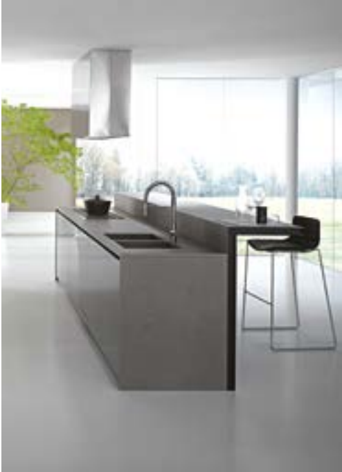
Kitchen by Modulnova