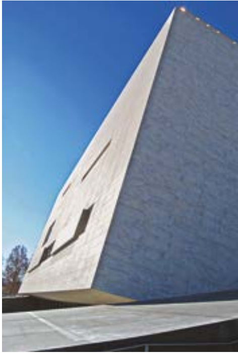
Nuovo Teatro dell'Opera Florence, Italy