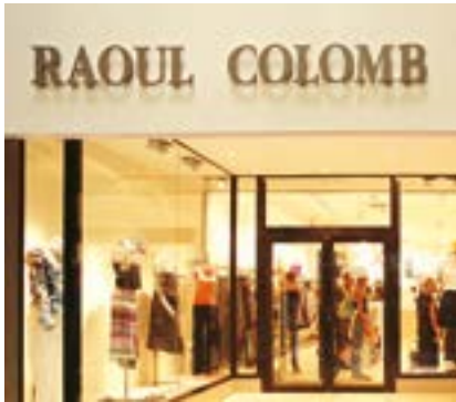
Raoul Colomb Lacoste Boutique Digne Les Bains, France