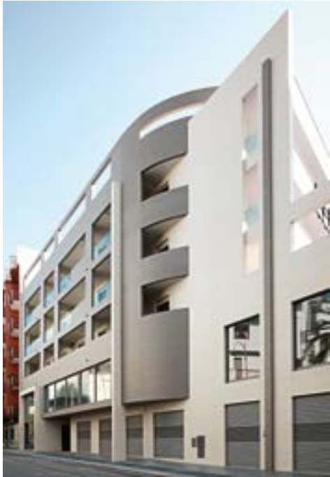
Residential Building Andria, BA Italy