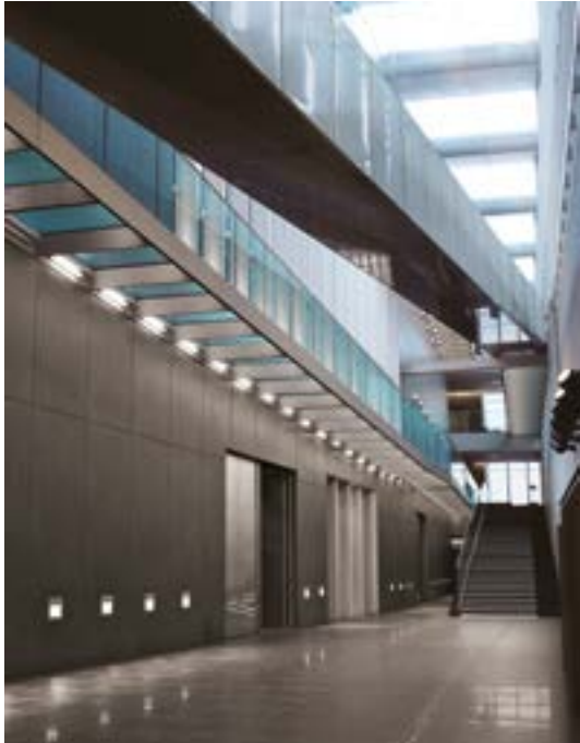
Ermenegildo Zegna Headquarters Milan, Italy