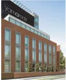
Yamamay Gallarate, MI Italy