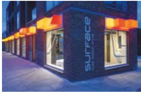
Surface Showroom London, UK