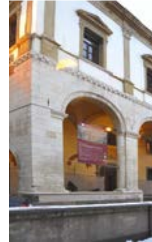
Palazzo del Monte di Pietà Padova, Italy