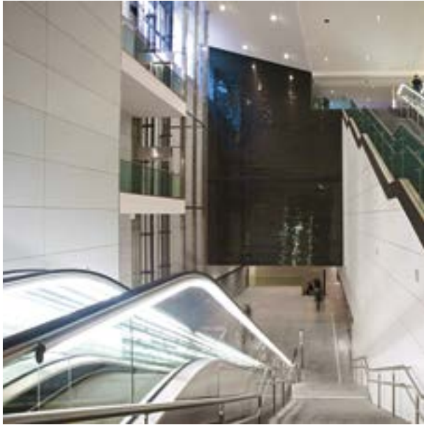
Subway Station Bresciadue Brescia - Italy