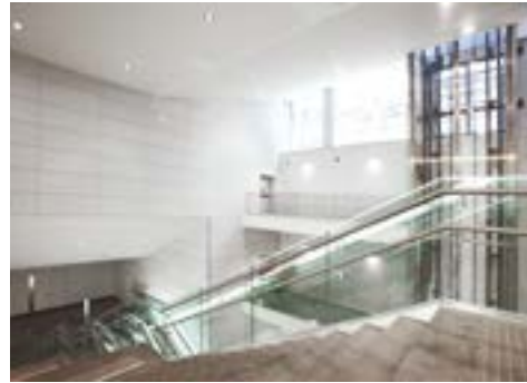
Skyway Monte Bianco Station Pontal d'Entrès, Pavillon du Mont Fréty and Punta Helbronner Courmayeur AO - Italy