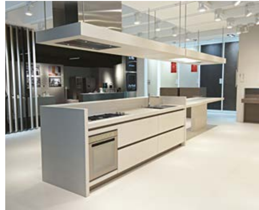
Kitchen by Arrital Cucine