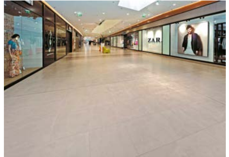
Portanova Shopping Centre Osijek, Croatia