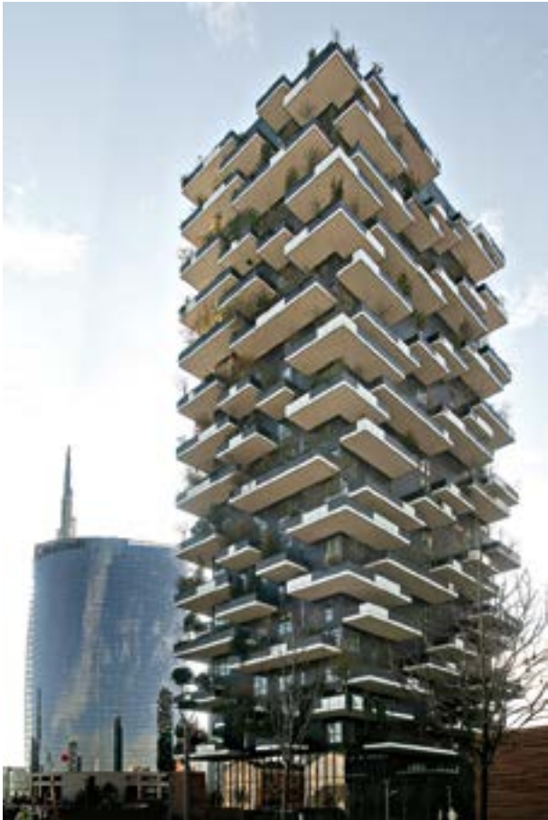
Bosco Verticale Residential towers Milano, Italy