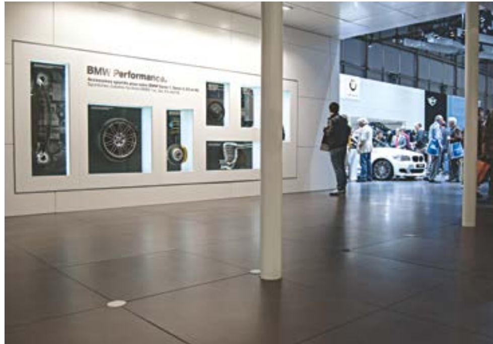
BMW Stand 81° International Motor Show Geneve, Switzerland