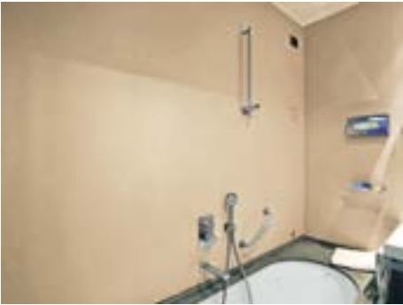
Golden Rays Luxury Villas Primošten - Croatia