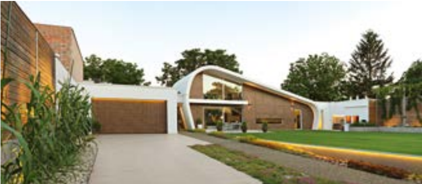
Private House Osijek, Croatia