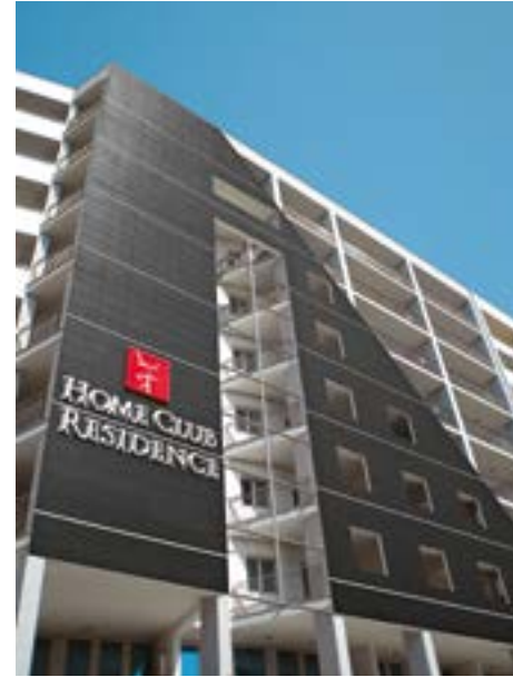
Home Club Residence Hotel Cosenza, Italy