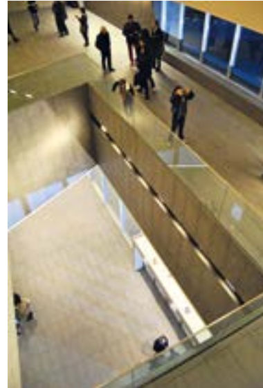
André Malraux Media Library Béziers, France