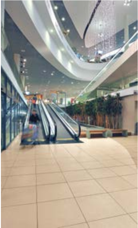
Coné Shopping Center Conegliano Veneto TV, Italy