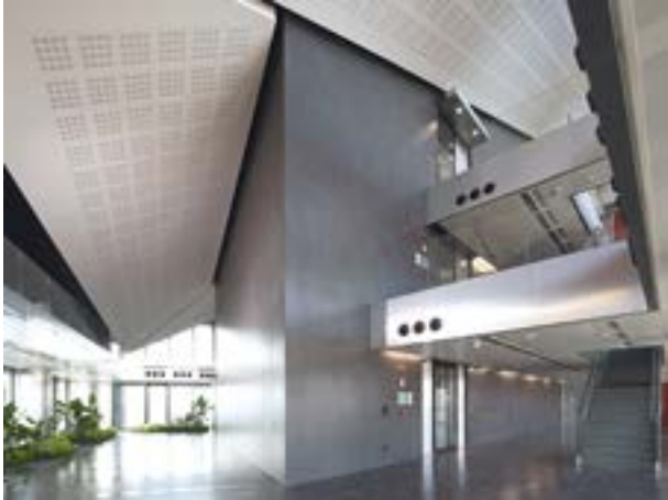
Unipol Tower Bologna - Italy