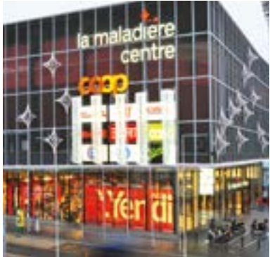
La Maladiere Centre Shopping Center Neuchatel, Switzerland