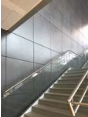
Sterilgarda Castiglione delle Stiviere, MN Italy