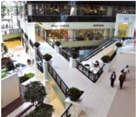
Plaza of the Americas Dallas, Texas USA