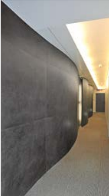
Royal Santina Hotel Rome, Italy