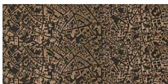
cordusio bronze 3D