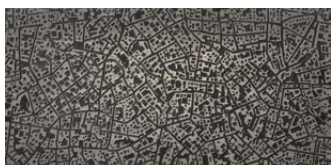
moscova antracite 3D